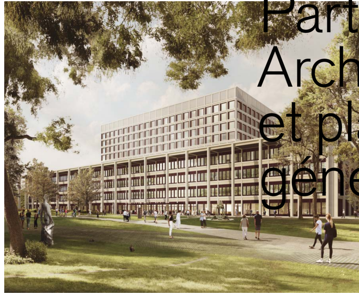
Visualisation: Pionne Images

Début 2019, nous avons remporté un concours d'architecture avec notre nouveau centre d'enseignement et d'apprentissage de la Hochschule RheinMain à Wiesbaden. Ce nouveau bâtiment aux apparences d'atelier invite les étudiants à la communication. La structure intérieure et la disposition des salles de ce nouveau bâtiment compact de quatre étages et d'une surface utile de 4000 m 2 offrent une très grande flexibilité. Les étudiants des différentes unités professionnelles y profiteront d'excellentes conditions d'apprentissage début 2023.