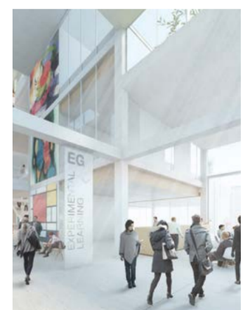
Visualisierung: Sou Fujimoto Ateliers

Den neuen Firmenhauptsitz für Borer Chemie in Zuchwil haben unsere Architekten mittels kollaborativem Building Information Modeling-Prozess (BIM) geplant und im Oktober 2019 der Bauherrschaft übergeben. Entstanden ist herausragende, imagebildende Industrie-architektur für das technologisch führende Unternehmen auf den Gebieten der Reinigung und der Desinfektion.