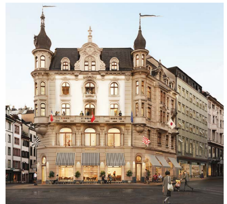
Visualisierung: Nightnurse Images

Unsere stilvolle Innenarchitektur kennzeichnet die Kinderkrippe «Crèche de Collonges» an der Avenue de France in Lausanne. Die Kinderkrippe wurde im Sommer 2019 bezogen und beherbergt 56 Kinder in einem Gebäude aus den 1930er-Jahren. Das Projekt ist Teil einer grösseren Gebäudesanierung von 125 Wohnungen und 15 Geschäften, die wir mit grösster Sorgfalt unter Wahrung der historischen Substanz für Helvetia Assurances durchgeführt haben.